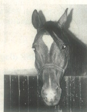
La TAC è indicata nelle patologie nella testa del cavallo.